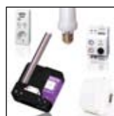
Receivers With the EasyTouchPanel10, you can control receivers. See the complete range of recei- vers at www.marmitek.com .