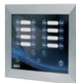
1x Touch Panel, 2x AAA Batteries incl.