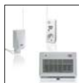
Transceivers Communication from transmitters to receivers goes via transceivers. See the com- plete range of transceivers at www.marmitek.com .