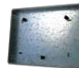
Back box to build the Easy Touch Panel10 in the wall. Art.nr. 09879