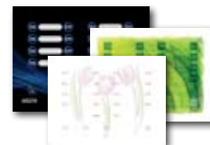
3x style sample